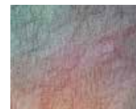
MIX COLOURS: LIMITED EDITION