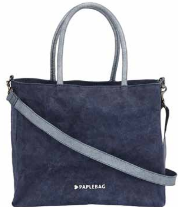
PEPPERWOOD SIZE: 30 X 12 X 25 CM | COLOURS: 3