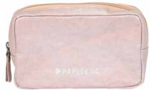
WALNUT SIZE: 18 X 6 X 12 CM | COLOURS: 4